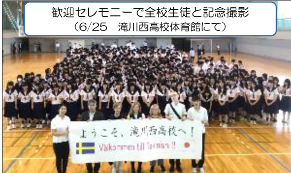
歓迎セレモニーで全校生徒と記念撮影 (6/25 滝川西高校体育館にて)

6/24～7/6 まで、スウェーデン ヴィトフェルスカ高校から4名の留学生を受け入れました。一昨年の11/1に交換留学協定を結び、今年度が3年目の受け入れとなりました。