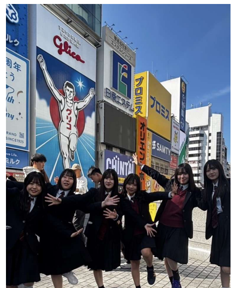
自主研修、道頓堀にて

ル充電器」と回答し、「スマホ」「交通系ICカードまたはアプリ」と答えた人が10人だった。また「日差しが強いからサングラスがあると良い」「単語帳を持って行って、移動時間などに取り出せるようにできれば良い」などの回答もあった。【担当…本間】